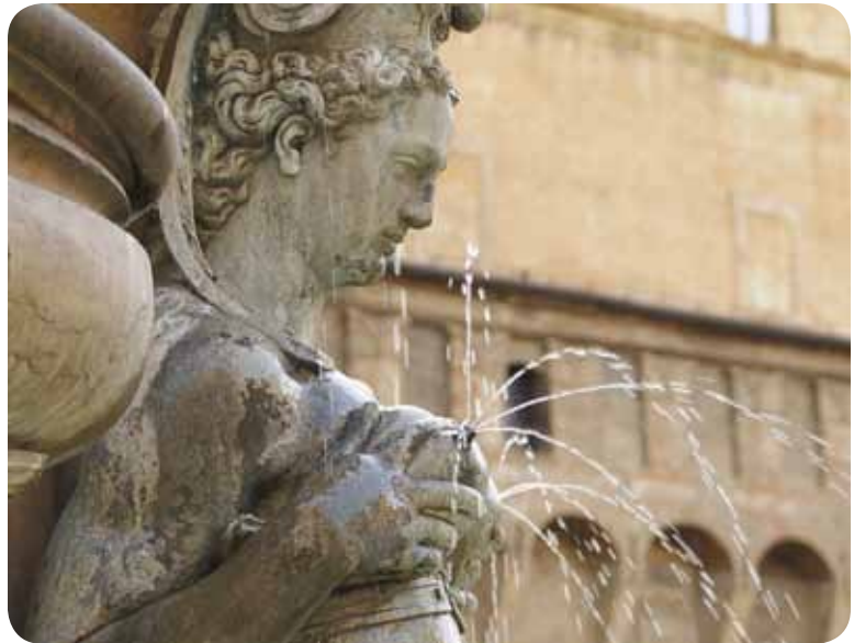
La fontaine de Neptune à Bologne en Italie

Depuis les trente dernières années, la promotion de l'allaitement maternel a connu un essor mondial important grâce à plusieurs initiatives développées par l'Organisation mondiale de la santé (OMS) et le Fonds des Nations Unies pour l'enfance (UNICEF) 2 . Au Québec, la promotion de cette pratique s'est également accrue depuis la parution, en 2001, des Lignes directrices en matière d'allaitement maternel du ministère de la Santé et des Services sociaux (MSSS) dans lesquelles le gouvernement affirmait sa volonté d'implanter dans les établissements de santé du Québec l'Initiative des hôpitaux des amis des bébés (IHAB). Ces dernières années, le MSSS a réitéré sa position en faveur de l'allaitement maternel dans son Programme national de santé publique 2003-2012 (MSSS, 2003, p.38) et dans sa Politique de périnatalité 2008-2018 (MSSS, 2008, p.58-59). À l'aube de la publication des nouvelles lignes directrices en matière d'allaitement, prévues pour 2012, que pensent les femmes enceintes de la promotion de l'allaitement au Québec? En réalité, les laisse-t-on libres de choisir ou non d'allaiter?