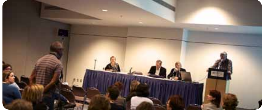
Le symposium L'information aux parents – Pouvoir d'agir ou d'obéir à Enfanter le monde

L'information concernant la consommation d'alcool pendant la grossesse, quant à elle, est plus complexe à transmettre. L'alcool est un produit reconnu tératogène mais, pour certaines femmes, l'abstinence peut nécessiter