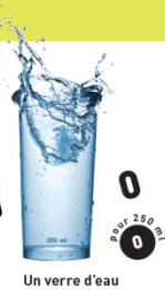
Un verre d'eau